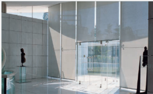
Rückseite weiß: Verbindung von hoher Wärmeleistung und Sichtkomfort