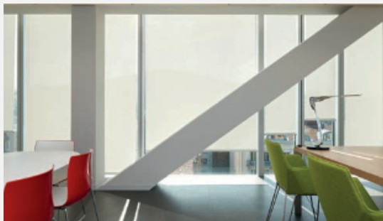
Version mit 2 farbigen Seiten: Effizienz, Design und Ästhetik