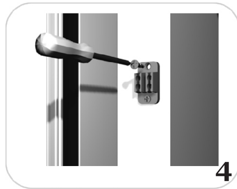
bei Option mit Kette Kettenhalter anbringen Die Funktion des "Kettenwandhalters" ist unverzichtbar für eine gute Widerstandsfähigkeit gegen Windkraft.