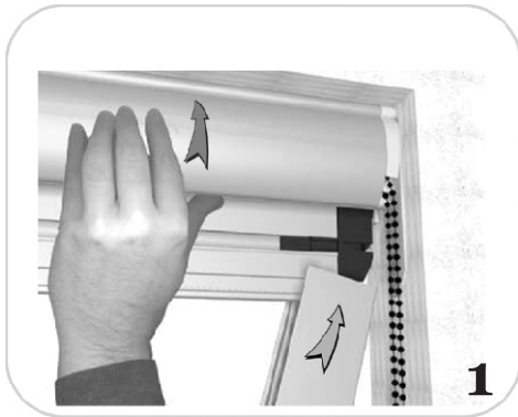
Kassetten auf Seitenschiene aufstecken