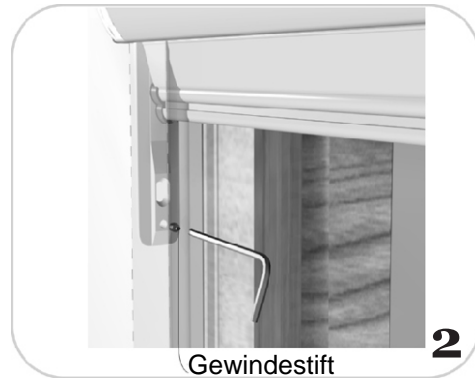
Gewindestift in Seitenschiene befestigen